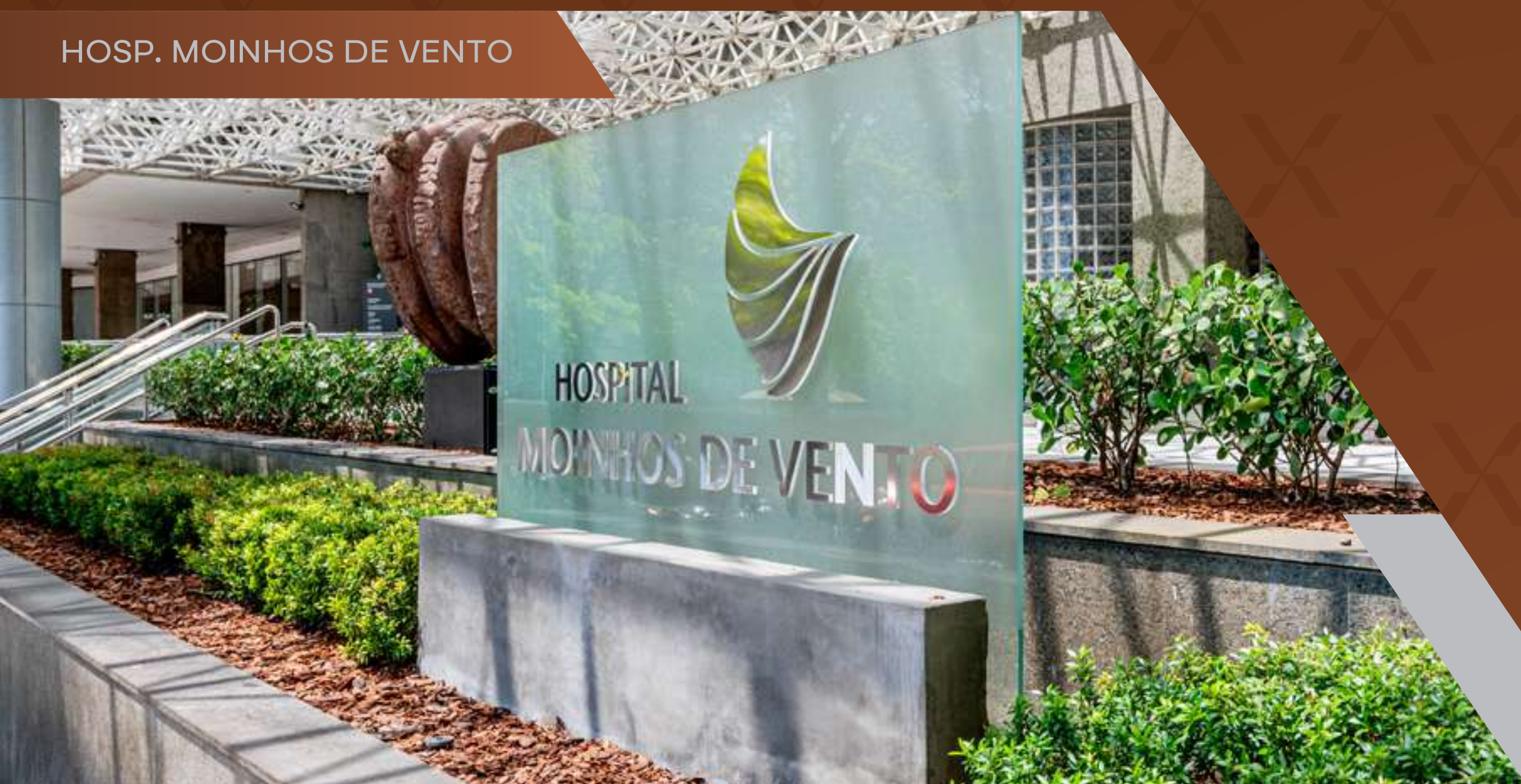
HOSP. MOINHOS DE VENTO