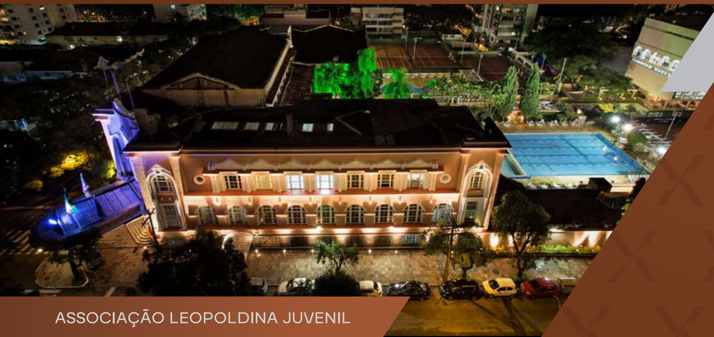
ASSOCIAÇÃO LEOPOLDINA JUVENIL