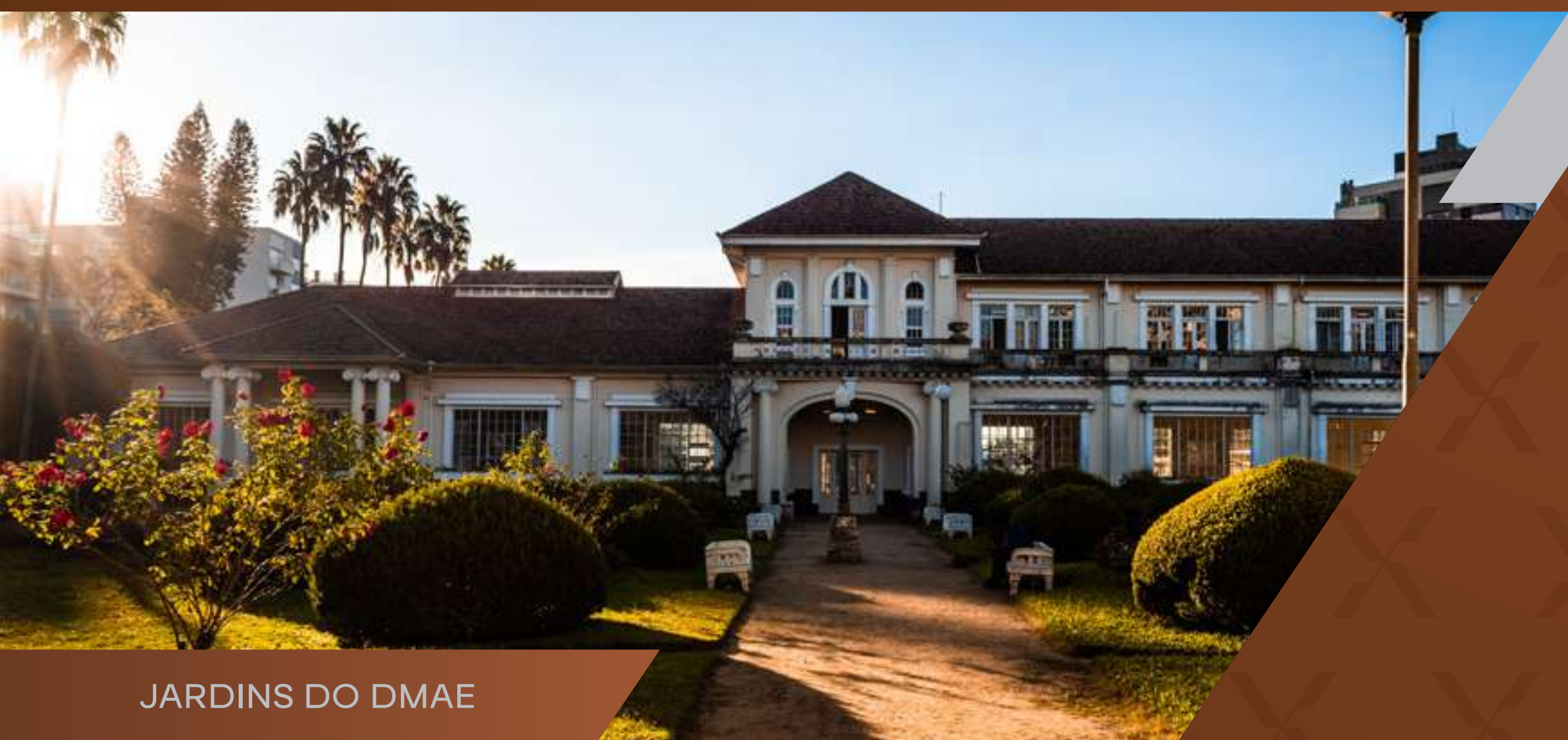
JARDINS DO DMAE