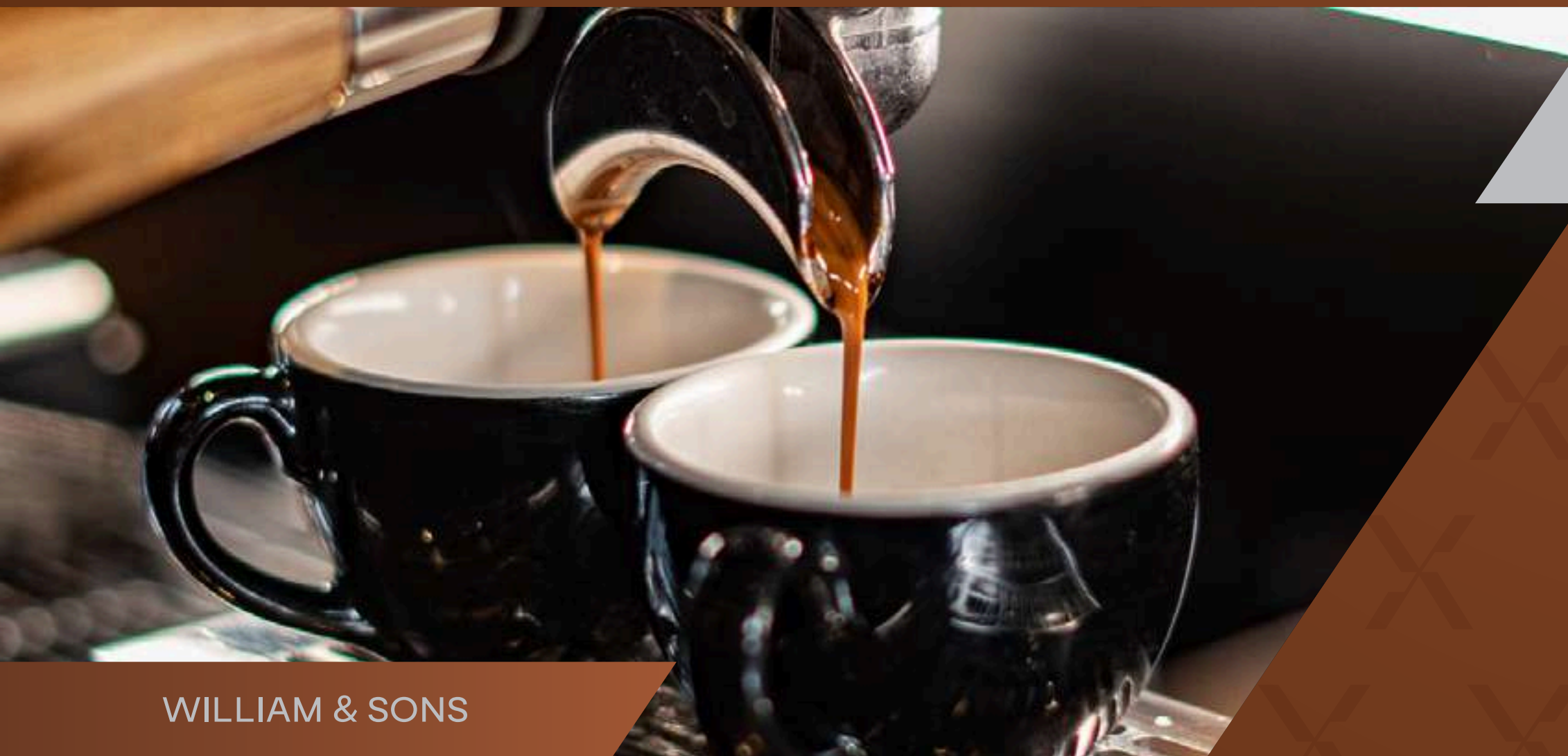
WILLIAM & SONS