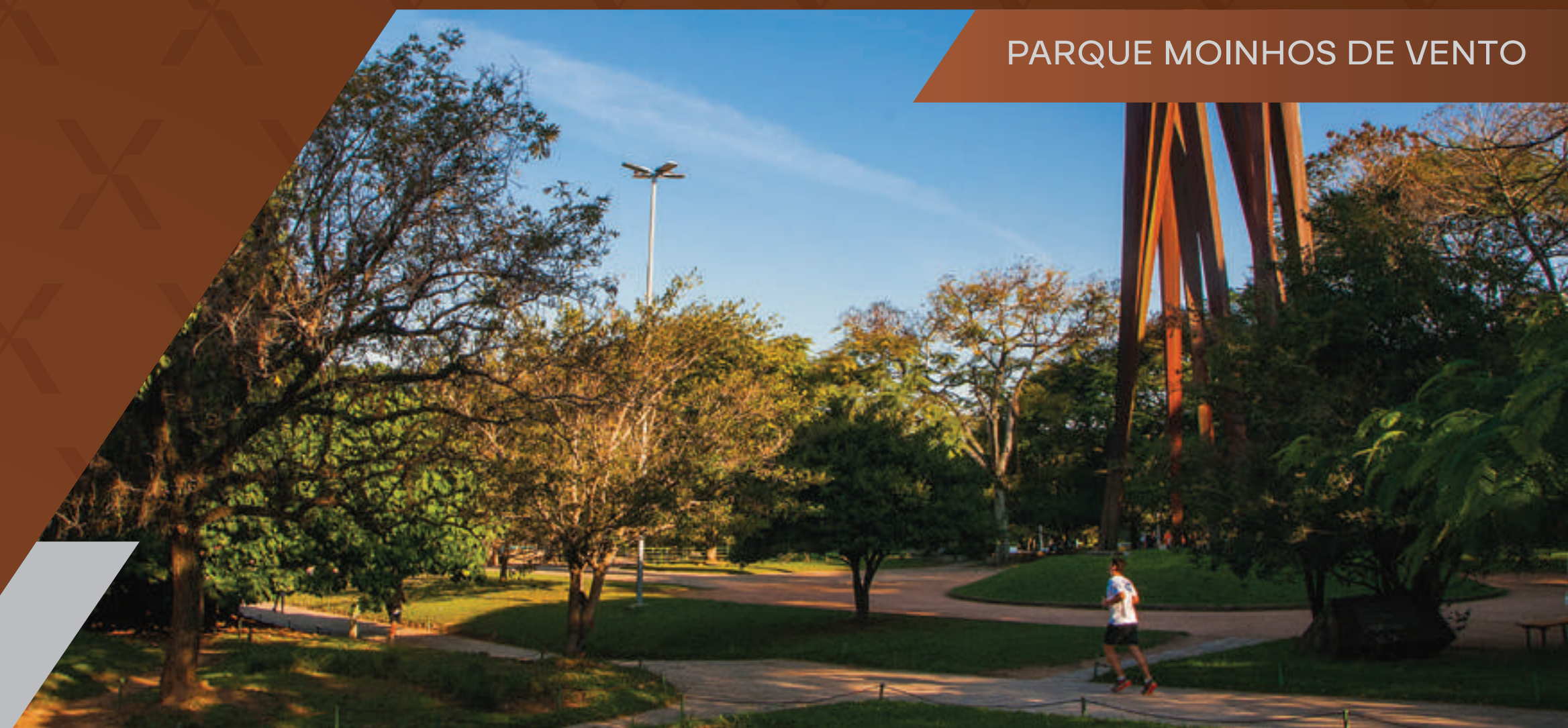
PARQUE MOINHOS DE VENTO

O FÉLIX MOINHOS ESTÁ LOCALIZADO EM UM PONTO PRIVILEGIADO DE PORTO ALEGRE, ONDE A CENTRALIDADE FACILITA OS DESLOCAMENTOS E O ENTORNO É UM CONVITE PARA CAMINHAR E VIVER AO AR LIVRE.